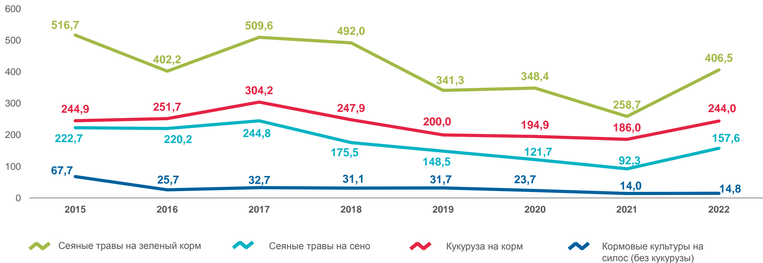
ПРОИЗВОДСТВО КОРМОВЫХ КУЛЬТУР ПО КАТЕГОРИЯМ ХОЗЯЙСТВ, В % ОТ ОБЩЕГО ОБЪЕМА ПРОИЗВОДСТВА В ХОЗЯЙСТВАХ ВСЕХ КАТЕГОРИЙ